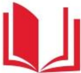
Логотип трека «Орлёнок – Эрудит»

Трек «Орлёнок – Эрудит» занимает первый месяц второй четверти, которая, чаще всего, отличается наличием различных олимпиад, интеллектуальных конкурсов, конференций и т.п. В этот период дети наиболее готовы знакомиться с разными способами получения информации, что необходимо для их успешной